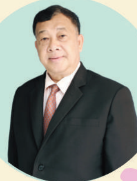
กรรมการวินิจจัยฯ