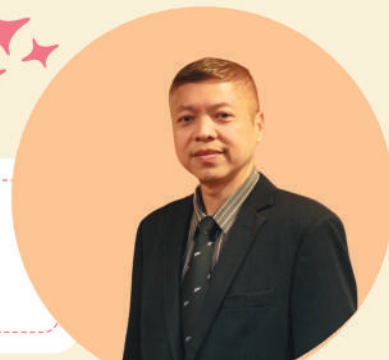
กรรมการวินิจจัยฯ