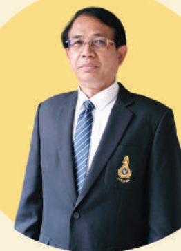
กรรมการวินิจจัยฯ