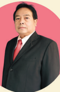
กรรมการวินิจจัยฯ