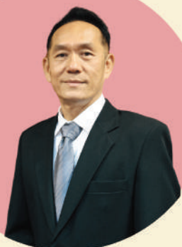
กรรมการวินิจจัยฯ