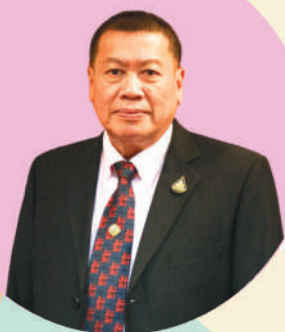
กรรมการวินิจจัยฯ